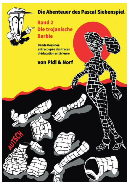
Band 2: Die trojanische Barbie Auf der Flucht vor den bösen Ideophagen reißt Siebenspiels Geliebte Kyoko wutentbrannt die Regie an sich. Eine wilde Jagd durch die Pop- wie auch die klassische Kultur. ISBN 978-3-7519-3701-6 2020, 56 farbige Seiten