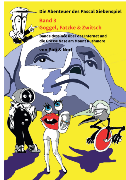
Band 3: Goggel, Fatzke & Zwitsch Siebenspiel und Kyoko legen den Internet-Bösewichten Goggel, Fatzke & Zwitsch unter dem Mount Rushmore das Handwerk. Ein Kultur-Roadtrip durch den Cyberspace nicht nur für Nerds. ISBN 978-3-7526-5875-0 2021, 56 farbige Seiten